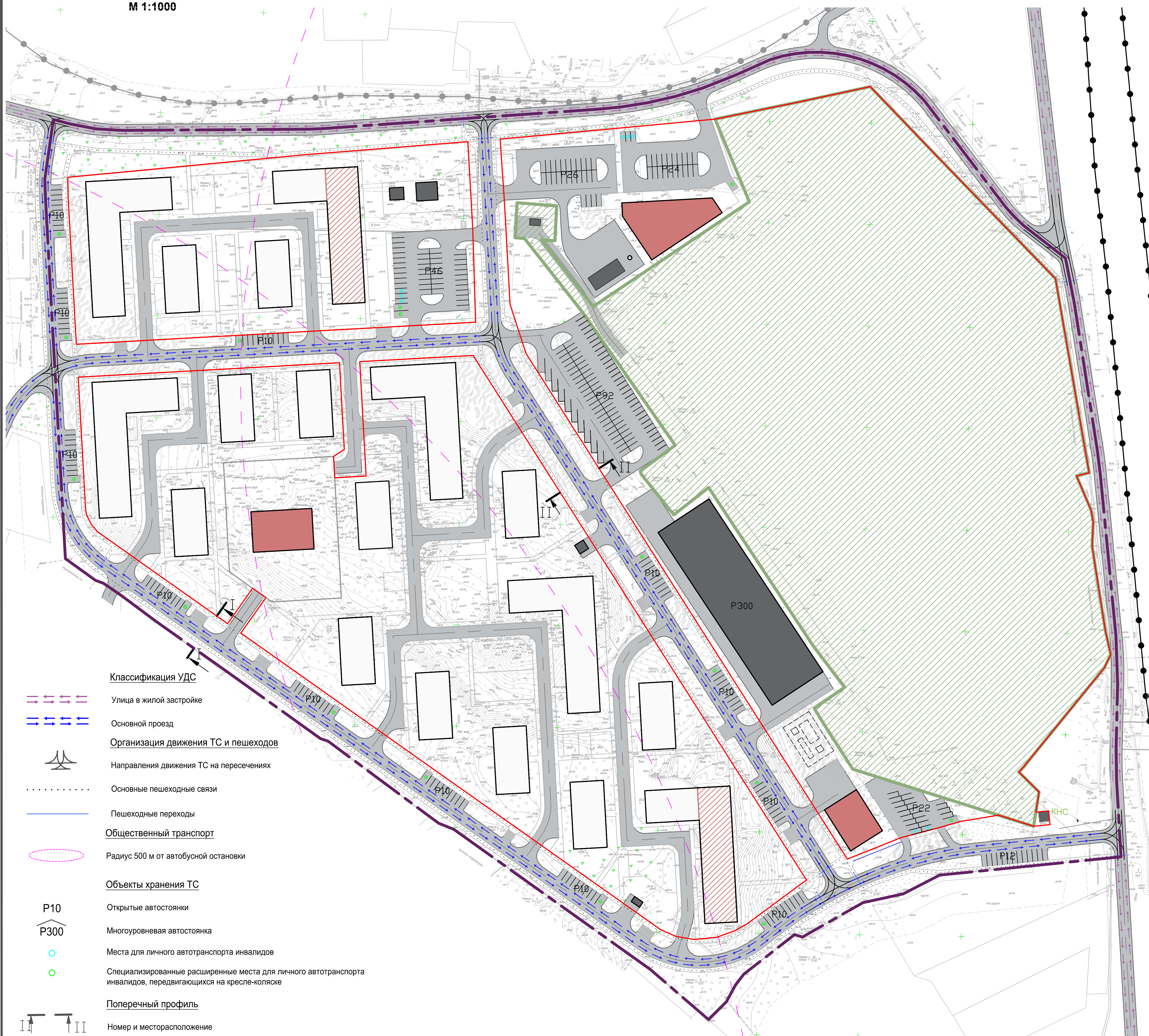
СХЕМА ОРГАНИЗАЦИИ УЛИЧНО-ДОРОЖНОЙ СЕТИ И СХЕМА ДВИЖЕНИЯ ТРАНСПОРТА М 1:1000